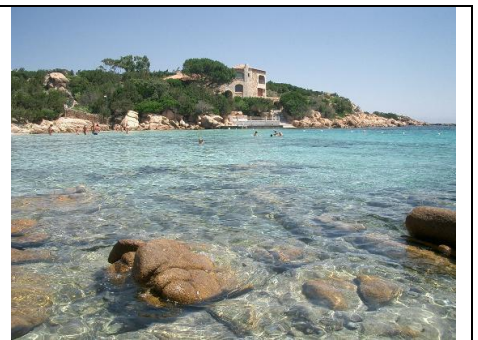
Spiaggia di Capriccioli (Arzachena)