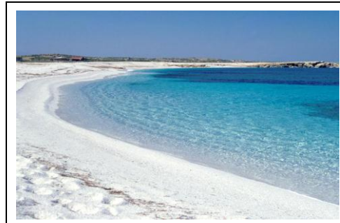
Spiaggia di Isa Rutas

Possibilità di escursioni facoltative con numero minimo partecipanti durante la settimana con nostro pullman tra le tante possibilità offerte dal territorio: Oristano, Tharros, Sinis, lo Stagno di Cabras, la famosa spiaggia di quarzo bianco di Isa Rutas, il nuraghe Losa, ecc.. Da decidere successivamente.