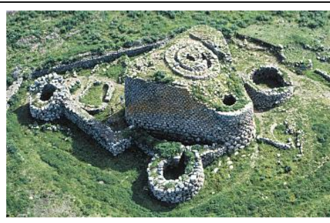
Il Nuraghe Losa